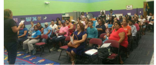
Parent meetings are a great way to stay involved at GBECC!